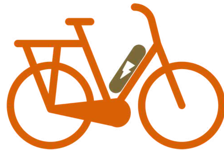
Modernes E-Bike ( Pedelec)